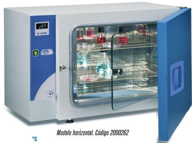
Modelo horizontal. Código 2000262